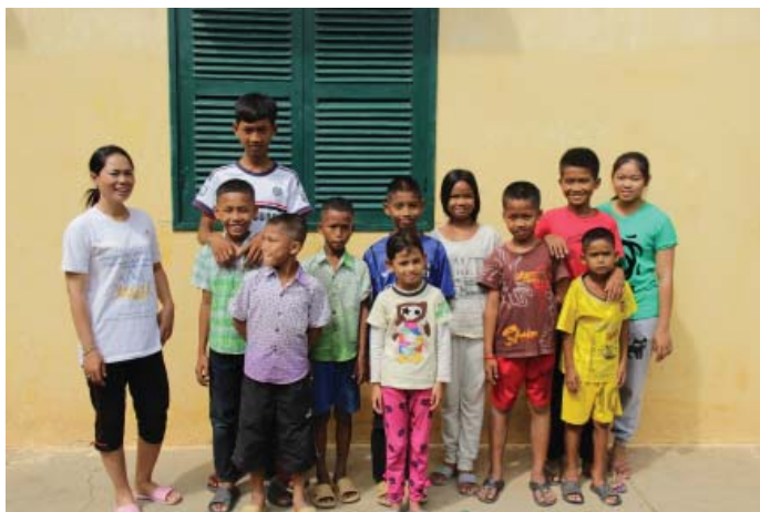
Alla invånarna i familjehem I i Battambang.

Under året har vi bland annat kunnat finansiera nödvändig utrustning av de två familjehemmen i Battambang. De två nya badrummen är de väldigt nöjda med. Man badar inte i karet, utan öser upp vatten med skopan och sköljer över sig. Dusch på khmer-vis!